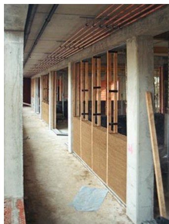
Ausführung der nichttragenden Wandteile aus Stampflehm. Die sogenannte »Kletterschalung« wird nach jeder neuen Schicht von eingestampftem Lehm hochgeschoben.